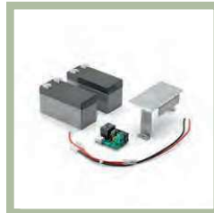
Door het plaatsen van een batterij back-up systeem in de motor kunt u deze ook gebruiken bij stroomuitval