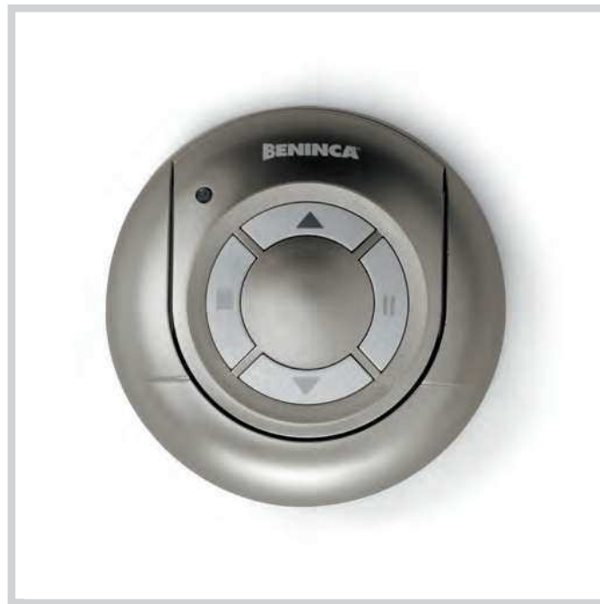
2-kanaals zelflerende rolling code handzender Geleverd met muurhouder voor binnengebruik