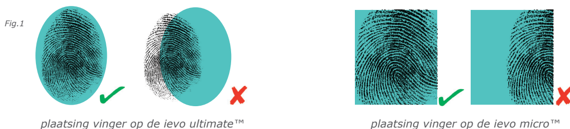
plaatsing vinger op de ievo ultimate™

Om het proces te starten plaatst u uw vinger op de sensorplaat van een actieve vingerafdruklezer. Zorg ervoor dat uw vinger het gehele oppervlak van de sensorplaat bedekt om te voorkomen dat onnodig licht de sensor overspoelt (zie fig.1). Houd uw vinger stil terwijl de sensor de vingerafdruk scant (dit wordt aangegeven door een wit licht dat door de sensor wordt uitgezonden) en verwijder uw vinger zodra het scannen van de sensor is voltooid.