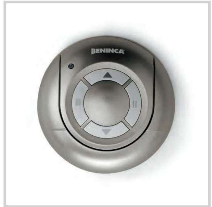
2-kanaals zelflerende rolling code handzender Geleverd met muurhouder voor binnengebruik