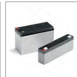
2,1Ah 12 Vdc batterij