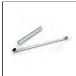
Schuifarm voor BEN