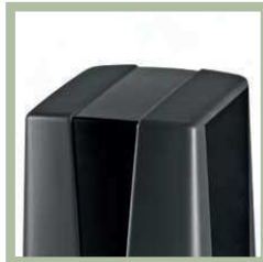
Eenvoudig compact design met de sterke kwaliteit van Beninca