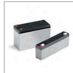
7Ah 12 Vdc batterij Moet worden geplaatst in een externe box