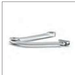
Knikarm voor BEN