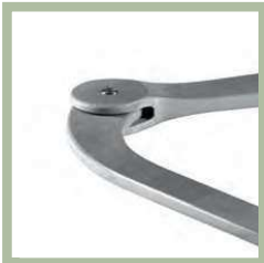
Knikarm gemaakt van behandeld aluminium