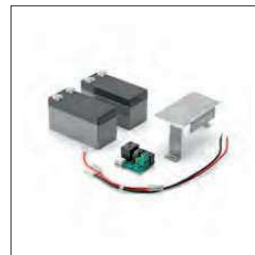
Accessoire voor CP.BEN bestaande uit een acculader kaart CBY.24V, 1,2 Ah batterijen en montagesteun voor de batterijen