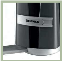
Ontgrendelingsmechanisme met sleutel