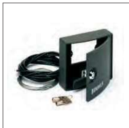
Extern te monteren anti-inbraak ontgrendelingsmechanisme Voor het ontgrendelen van de poort van buitenaf

BN.SE 9090019 BA 9099053 BN.BS 9099002 BN.CB 9760072 BN.24V 9760073 DA.BT6 F8086020 DA.BT2 F8086010